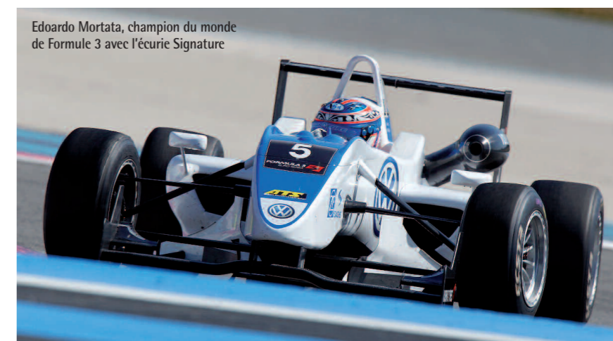
Edoardo Mortara, champion du monde de Formule 3 avec l'écurie Signature

Signature a apprécié l'implication des acteurs de l'Innovation et souhaite poursuivre cette collaboration dans de nouveaux projets. « Nous développons cette année d'autres projets collaboratifs, lourds cette fois, également aidés par Cap R&D (Région Centre) et l'Europe, pour l'hybridation et l'électrification d'un véhicule de course ». Verdict en fin d'année.